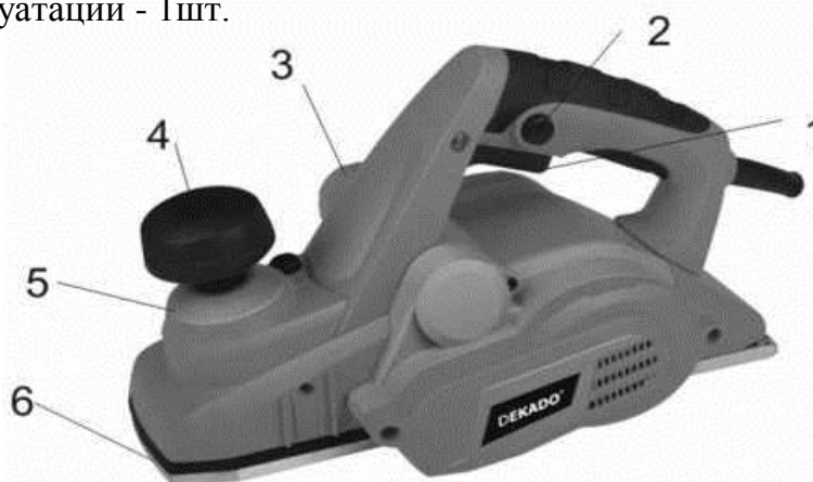
Рис. 1 Рубанок электрический

В комплект поставки входят: Рубанок электрический - 1 шт. Инструкция по эксплуатации - 1 шт.